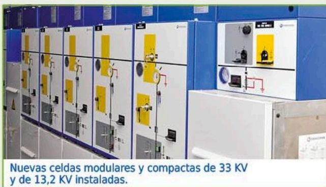
Nuevas celdas modulares y compactas de 33 KV y de 13,2 KV instaladas.

Si, la nueva línea entre Anexo II y la Estación Transformadora Flandria, por un monto que supera los $ 4.000.000. Esta obra beneficia con mayor potencia y confiabilidad el servicio para las localidades de Jáuregui, Cortínez y alrededores. Otra de las obras que ya está en servicio, aunque aún le falta la finalización de la parte de obra Civil es la "Repotenciación de Estación Transformadora Flandria". Esta obra consistió en la instalación de dos nuevos transformadores que duplicarán la capacidad, además se ha modificado la tecnología para darle mayor confiabilidad y capacidad de respuesta. La inversión es de $ 7.500.000 y la zona especialmente beneficiada es Jáuregui, Olivera, Barrio Loretto, la zona sur de la Ruta N° 47, la parte de Pueblo Nuevo, Cortínez, y el corredor hacia el lado del peaje de Ruta N° 7. Así también alimenta la parte Industrial de la zona.