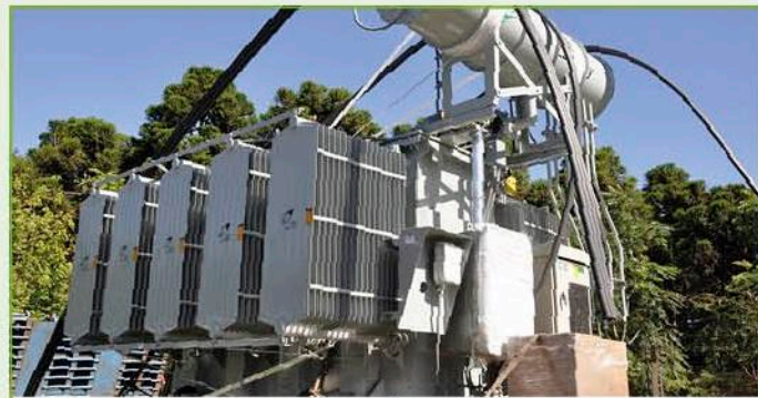
Nuevo transformador de la Estación Transformadora Flandria

2. Ampliación de Capacidad de Transformación Estación Transformadora Luján II: Se adjudicó la obra a la Empresa PROA S.A. por un monto de $14.700.000. Se está en la Etapa de Replanteo y Proyecto.